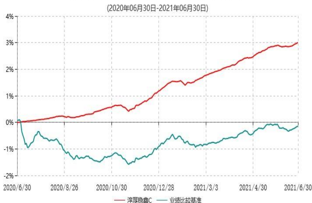
淳厚稳鑫C累计净值增长率与业绩比较基准收益率历史走势对比图

注：本基金基金合同生效日为 2020 年 6 月 30 日。按基金合同规定，本基金自基金合同生效起 6 个月内为建仓期。建仓期结束时本基金的各项投资比例均符合基金合同约定。