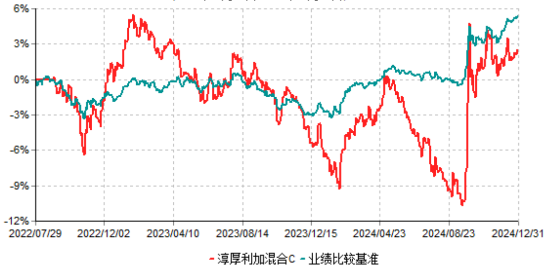
淳厚利加混合C累计净值增长率与业绩比较基准收益率历史走势对比图 (2022年07月29日-2024年12月31日)

注：本基金基金合同生效日为2022年07月29日。按基金合同规定，本基金自基金合同生效起6个月内为建仓期。建仓期结束时本基金的各项投资比例均符合基金合同约定。